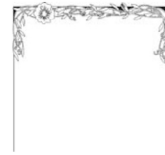
CANTONNIÈRE DE FLEURS